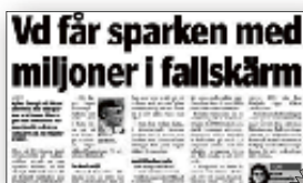
Barometern den 18 augusti 2011.

Kort senare lämnade han styrelsen, mest därför att han arbetar på annan ort och inte kan delta i mötena