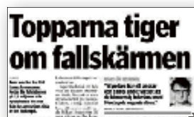
Barometern den 19 augusti 2011.

på det sätt som han skulle önska - men också för omständigheterna kring avsättandet av vd:n.